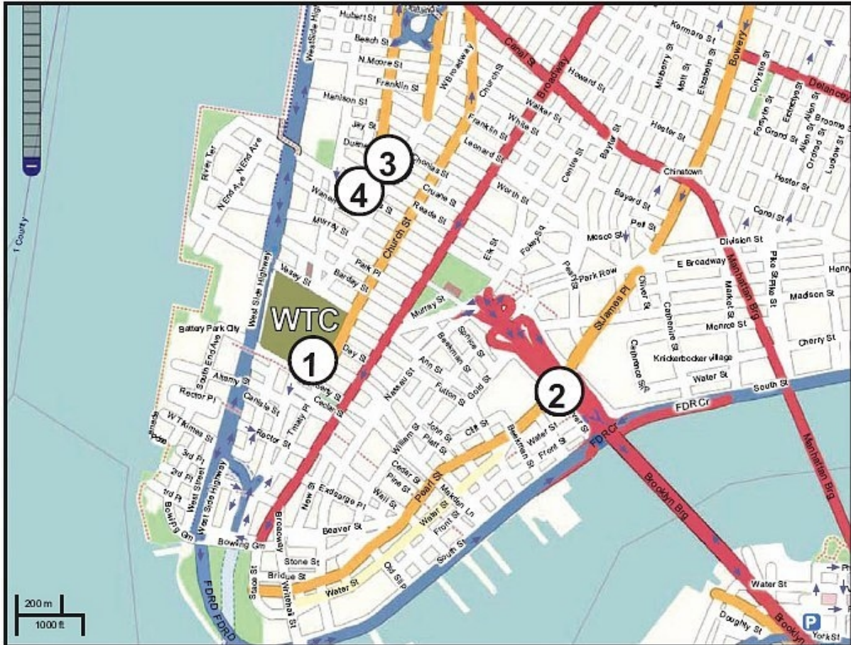
Bildunterschrift: Orte, an denen die Staub-Proben genommen wurden

gulli.com: Wie haben Sie zu 100% sichergestellt, dass der Staub, welchen Sie analysiert haben nicht verändert wurde, oder dass irgendwer ihn mit Nano-Thermit vermischt hat, bevor Sie ihn analysiert haben?