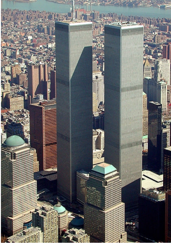
Bildunterschrift: World Trade Center

gulli.com: In Ordnung. Wo, warum und wie genau sind Sie an den Staub gekommen? Wie haben Sie sichergestellt, dass es reiner Original-Staub vom 11. September ist? Waren Behördenvertreter anwesend, als Sie die Proben genommen haben?