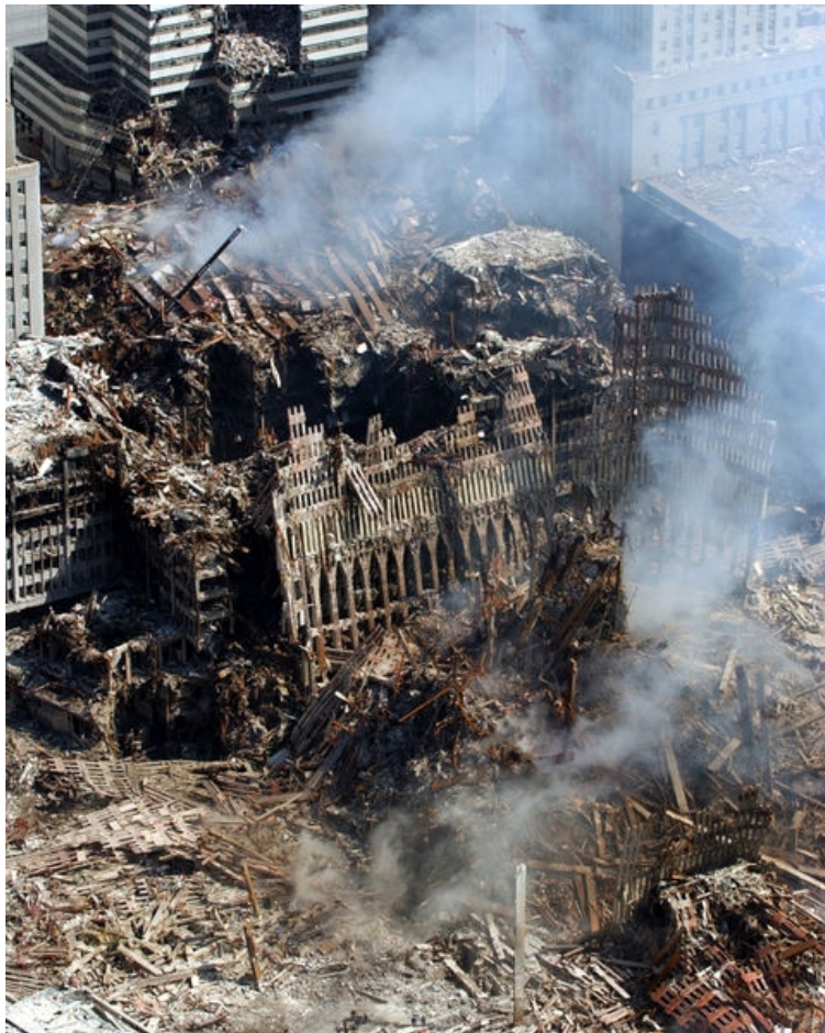
Bildunterschrift: Ground Zero